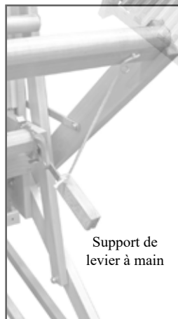
Support de levier à main