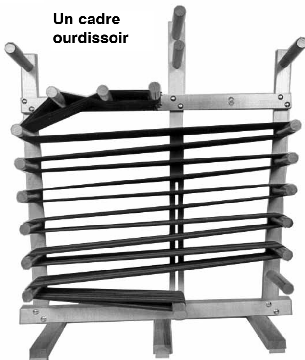
Un cadre ourdissoir

Le métier "Inkle" est un métier très simple et conçu pour le tissage de bandes étroites et fortes. Peut fabriquer des bandes de grandeur maximale de 6" de large par 16 pieds de long. Le tissage est en même temps rapide, silencieux et attrayant. Des articles tels que ceintures, cravates, courroies de guitare, etc. peuvent être tissés en une heure. Des bandes de 6" de large (15 cm) peuvent être faites sur ce métier. En joignant ces bandes, vous pouvez obtenir des coussins, des pièces murales, etc. Le cendrel peut aussi être un excellent cadre ourdissoir, un outil de base pour tout tisserand. Peut ourdir une chaîne jusqu'à 10 verges.