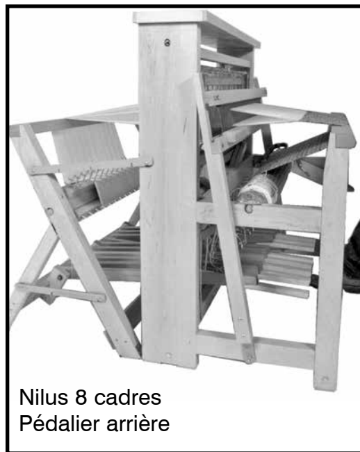
Nilus 8 cadres Pédalier arrière